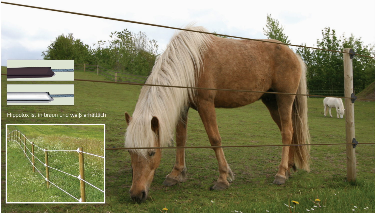
Hippolux ist in braun und weiß erhältlich

Dieser einzigartige Koppelzaun erfüllt die Kriterien Sicherheit, Zuverlässigkeit, Sichtbarkeit, optimale Stromführung und Langlebigkeit und steht für ein minimales Verletzungsrisiko. Ein Hippolux Festzaun ist die allerbeste Elektrozaunlösung zur dauerhaften Einzäunung Ihrer Pferdeweide. Hippolux ist ein ummantelter Pferdezaundraht mit einem Durchmesser von 8-9 mm, und einem innenliegenden Stahlkern mit einem Durchmesser von 2,5mm. Durch drei hochleitfähige Kohlefaserstreifen wird die Spannung nach außen geleitet und bildet somit einen Spannungsfilm rund um das Kabel. Kurzum der perfekte, beständige Stromleiter für Ihren Pferdezaun.